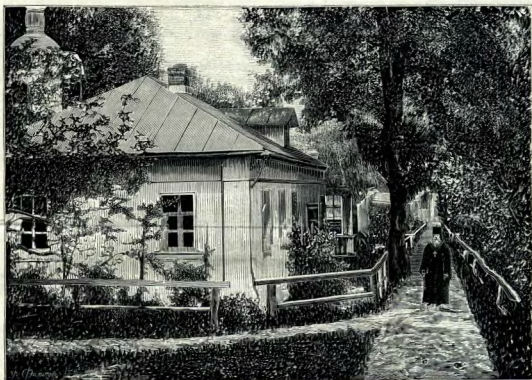
Келлія о. Амвросія.