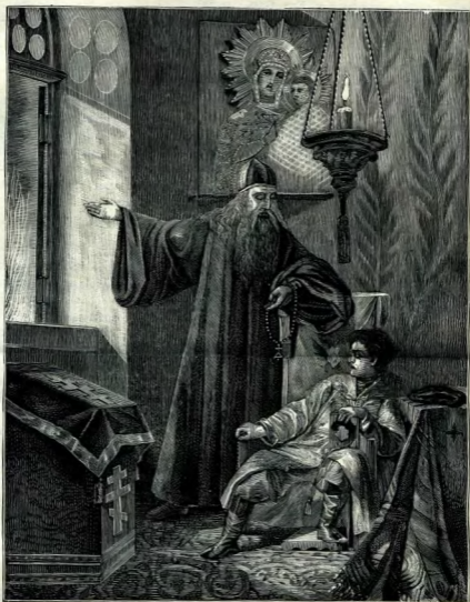
Сильвестръ и Іоаннъ Грозный.

ній (явленныи) намъ: ибо за наши прегрѣшенія Единый чистый и нетлѣнный, содѣлавшись человекомъ, очищается для нашего очищенія, освящая насъ и воды, и ель водѣ сокрушая главы змѣевъ. Братья! почерпнемъ воду съ веселіемъ, ибо съ вѣрою почерпающимъ подается отъ Христа Бога и Спасителя душъ нашихъ невидимо! благодать Духа».